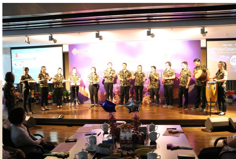
“文发好声音 唱响中国梦”在京企业职工卡拉OK比赛掠影

公司群团组织按照延续传统、探索创新的工作思路，精心策划组织开展了多项有益于职工身心健康的活动和维护职工权益的工作，为企业改革发展保驾护航。通过举办健走活动、乒乓球比赛等具有企业特色、丰富多彩的文化活动，营造融洽、积极的企业文化环境。