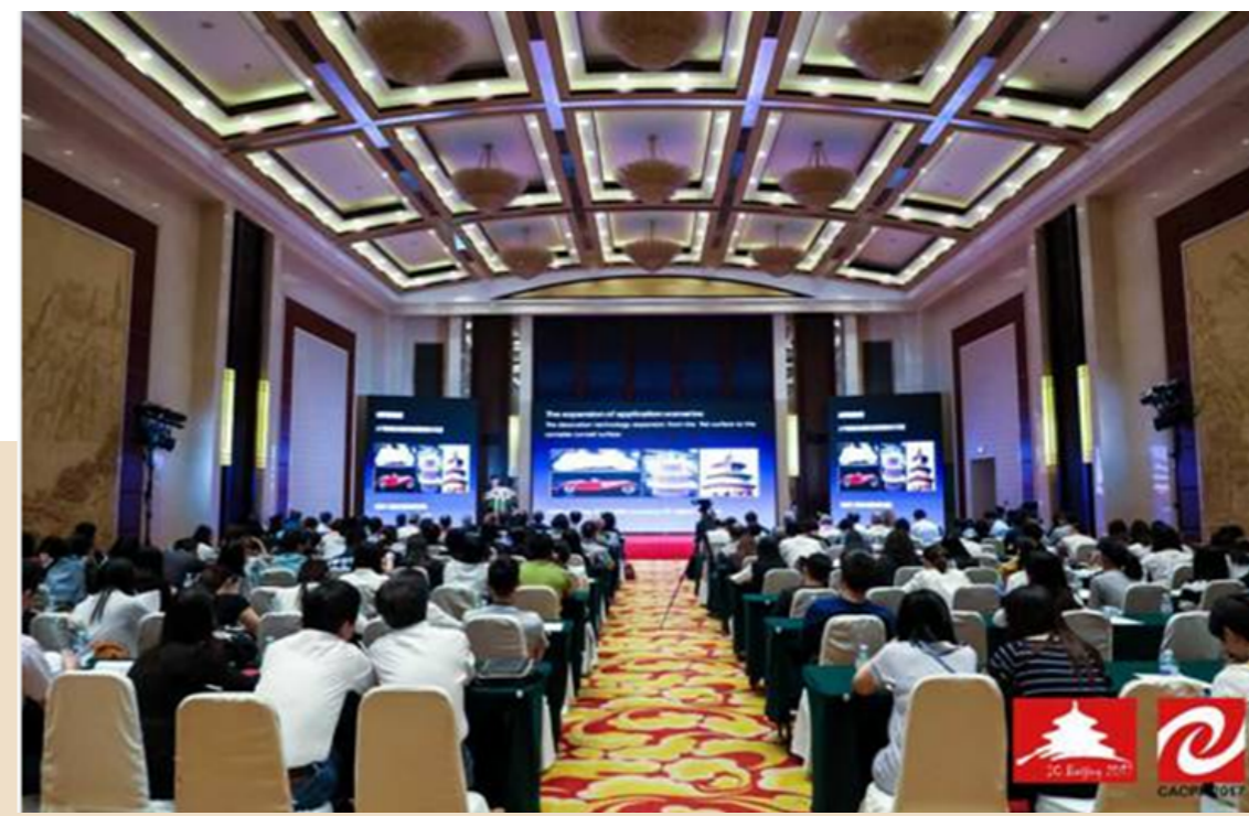
2017 第 49 届国际印刷技术与管理教育培训机构年会暨第 8 届中国印刷与包装学术年会