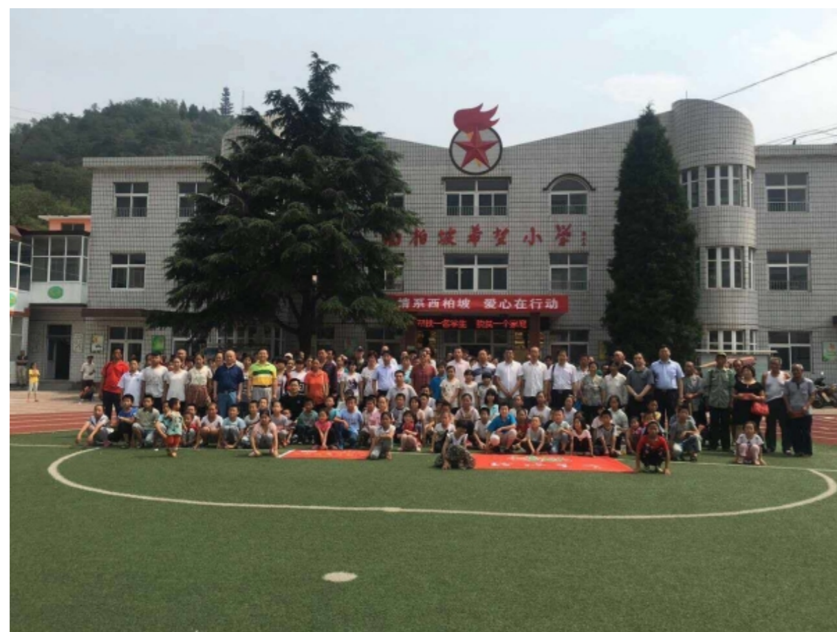
“汇聚众爱心，共圆学子梦” 爱心助学金发放仪式