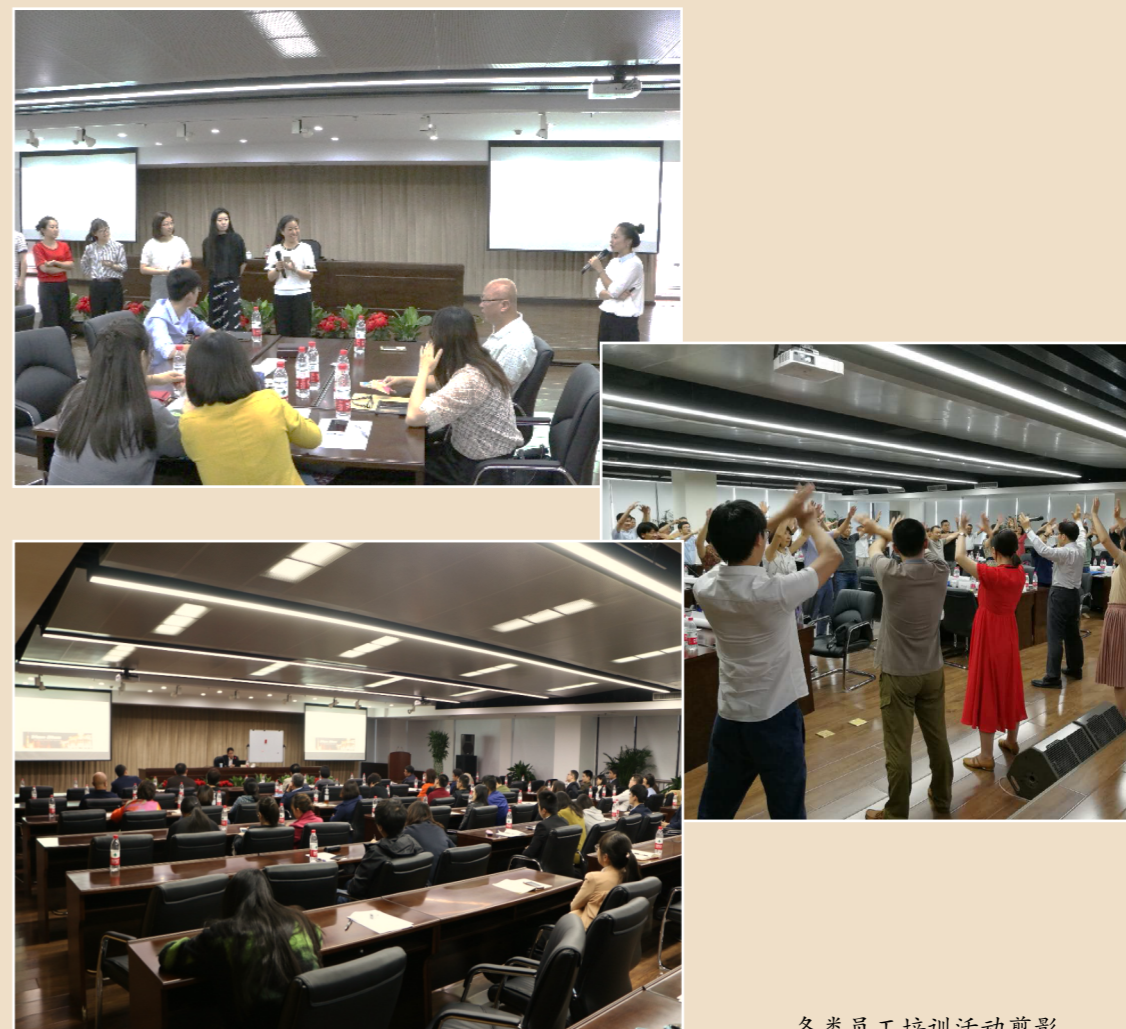
各类员工培训活动剪影

中国国新构建了以岗位职责和任职条件为核心的职务职级体系，明确各岗位职责和任职资格条件，畅通员工成长通道。晋升的依据是个人业绩、能力水平，为杜绝出现“到点晋升”和“熬年头”现象，我们规定，工作年限作为职务职级晋升的参考，不作为职级晋升的条件。中国国新搭建全面系统的人才培养机制，定期开展人才资源盘点，探索建立员工职业发展档案，加大员工培训培养力度。在公司总部层面，实行部门负责人竞争上岗。公司于 2017 年 5 月组织开展综合业务部、公司办公室、人力资源部、专职外部董事工作部、资产管理部等多个部门副职岗位的内部公开竞聘工作，选拔产生了 8 位部门负责人。此外，2017 年底公司总部实施组织架构调整，在部门以下增设处室，选拔了一批业绩突出、年富力强、具有较大发展潜力的干部担