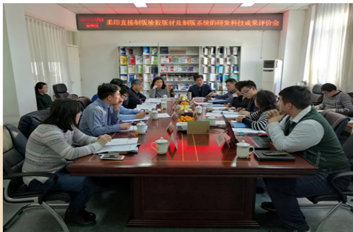
《柔印直接制版橡胶版材及制版系统的研发》项目科技成果评价会

2017 年 5 月 14 日，中印科院联合北京印刷学院、国际印刷技术与管理教育培训机构、中国印刷技术协会共同主办“2017 第 49 届国际印刷技术与管理教育培训机构年会暨第 8 届中国印刷与包装学术年会”。来自北京印刷学院、华南理工大学、西安理工大学、天津科技大学、瑞士林雪平大学、斯图加特媒介大学、华沙工业大学等海内外 60 多所知名印刷包装相关院校、机构、企业等 200 多位代表参加了会议。与会的代表们参观了雅昌（北京）艺术中心和北人亦创智能机器人创新园，探讨了印刷与包装学术前沿科技，并探寻了印刷教育及人才培养新模式。通过学术交流，推动印刷包装科研创新与进步、提升印刷包装学术水平和国际影响力，搭建起国际化的学术交流平台。