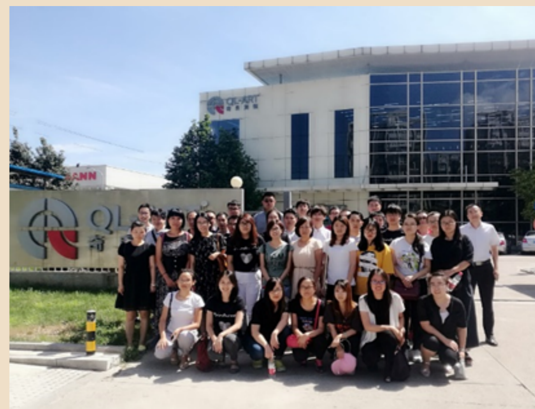
参观北京奇良海德印刷有限公司