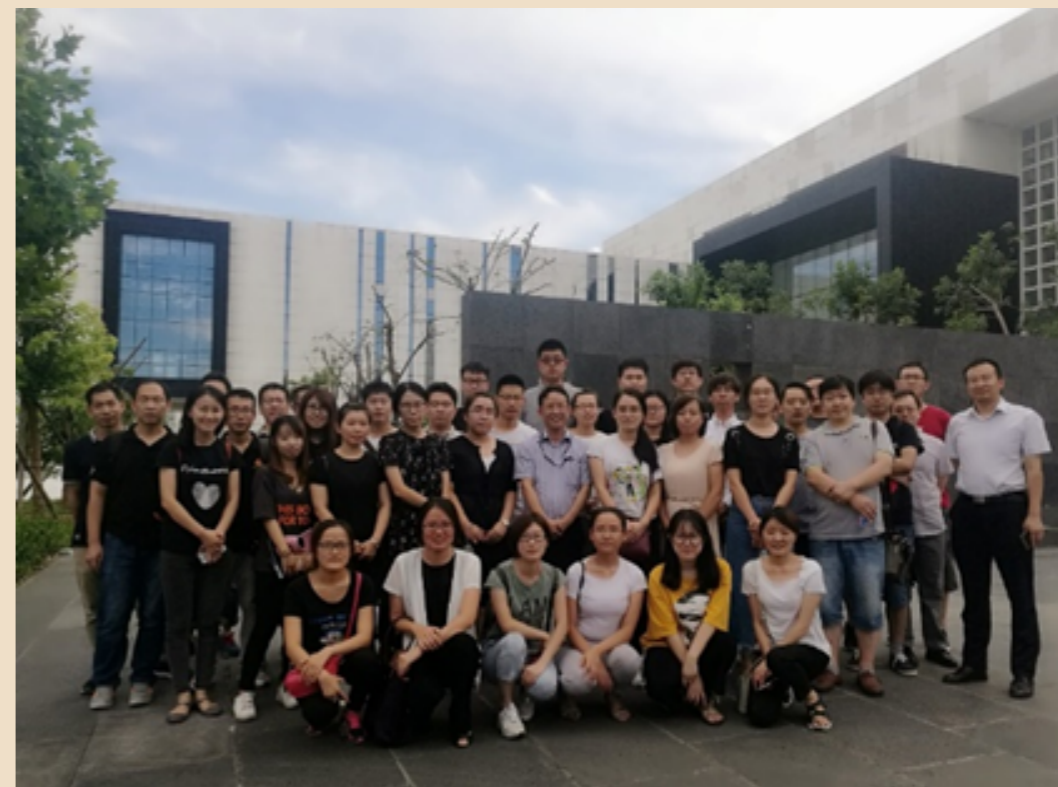
参观雅昌艺术工厂

作为中文发集团科技创新主体企业的中国印刷科学技术研究院有限公司（以下简称“中印科院”），2017年先后修订了《中国印刷科学技术研究院科研项目奖励办法及实施细则（2017年）》、《中国印刷科学技术研究院科研产品销售奖励办法及实施细则（2017年）》，以严格考核为前提，坚持以推动高效、高质完成项目或推广销售任务为导向，力求充分调动科研人员、推广及销售人员的工作积极性，全力推动科技成果产业化。高度重视和加强学术带头人后备力量的培养，实施青年人才培养计划，2017年共有6名青年人才获得培养机会。积极开展对外交流活动，支持科研人员“走出去”，2017年10余名一线科研人员共参加学术交流、行业论坛20多场，赴企业调研20家。通过带领研发团队外出交流，提升了研发团队创新思维能力。