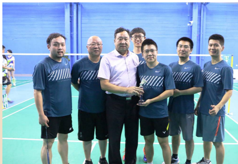
第二届在京企业职工羽毛球赛