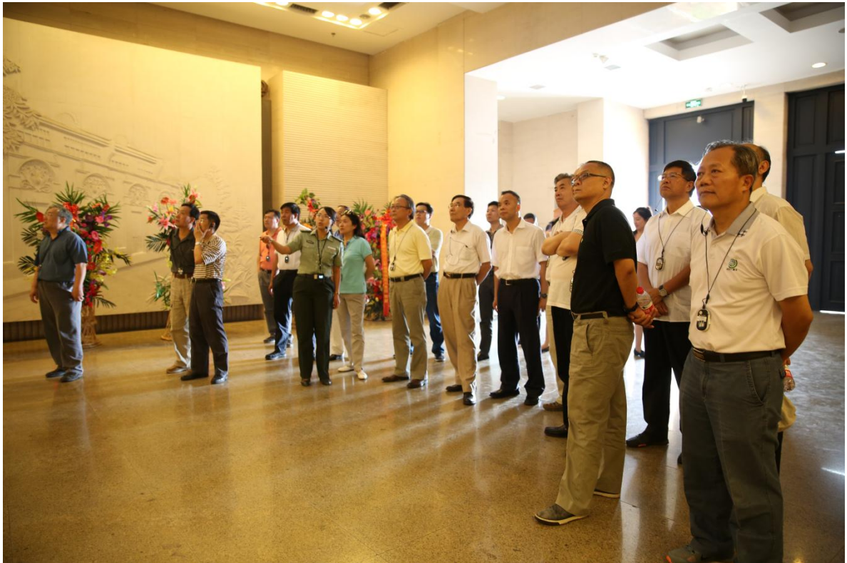
图：中央企业专职外部董事党支部赴西柏坡开展“两学一做”活动调研