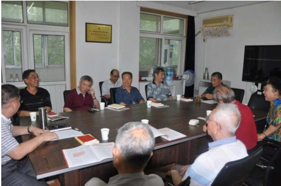
召开复转军人代表座谈会