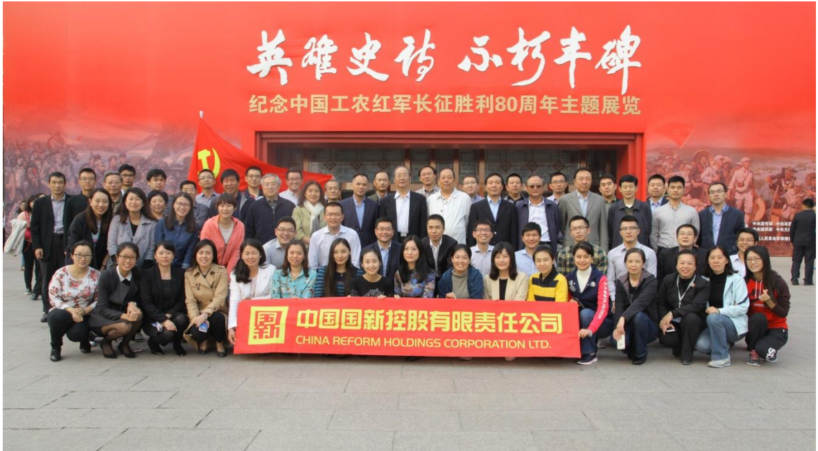
中国国新组织员工参观纪念红军长征胜利 80 周年主题展览