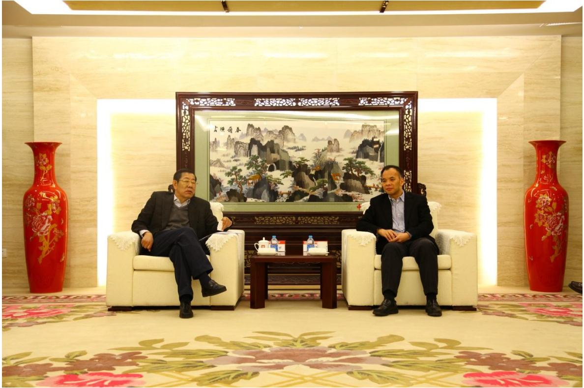
莫德旺总经理会见天津市政协王治平副主席