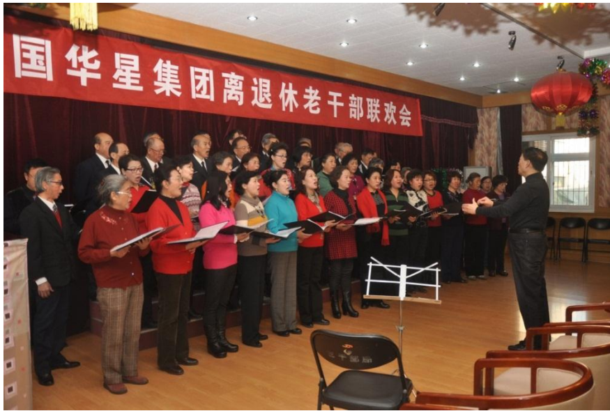
举办离退休老干部联欢会