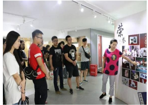
各类职工培训活动掠影