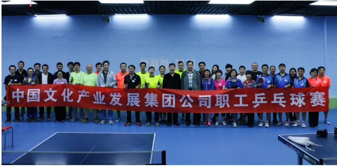
中文发集团第二届职工乒乓球赛

中国国新努力为员工办实事、办好事、解难事。华星集团离退休人员管理服务中心主动了解员工的实际情况，及时开展慰问帮扶工作。